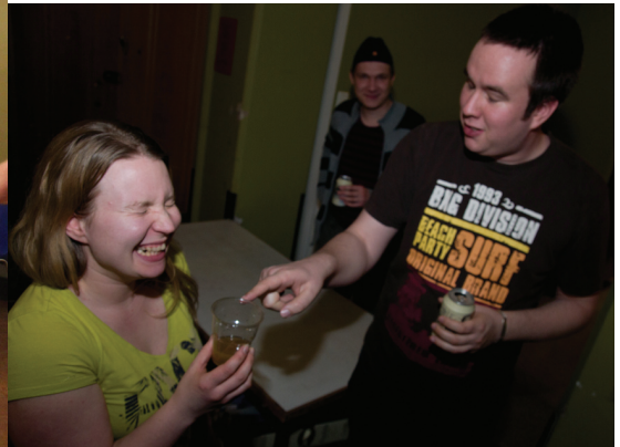
"Minkälaista viinaa tuo absintti on?"