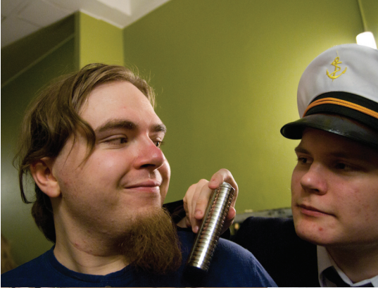
Puheenjohtajaa pidettiin hyvänä tekijän laivasimulaattorissa, eli Kevään bileissä.