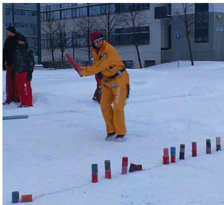
Tarkkaakin tarkempi tähtäys...