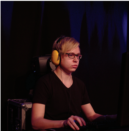
Welmu keskittymässä suoritukseen.

Kyllä, olin tyytyväinen. Aikataulut olivat kunnon ja pelaajille oli tällä kertaa järjestetty oma "lounge"-tila, jossa oli mukava sitten hengailta. Lanittaja tuntui taas riittävän paljon ja tunnelma oli sen mukaista.