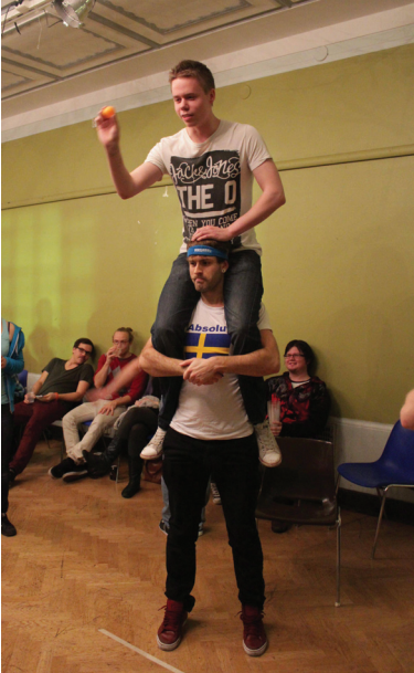
TKO-äly edustaa Matrixin beer pong -turnauksessa.