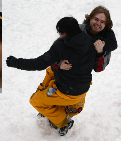
Pakkanen ei viilentänyt tunteita pulkkamäessä.